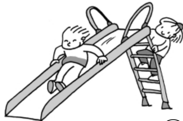
Tirarme por el tobogán