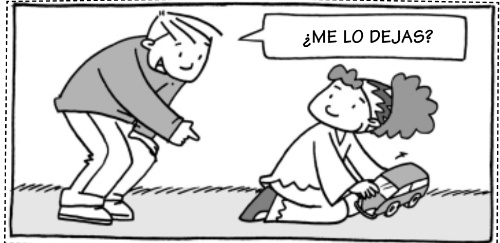
Pedir los juguetes a los niños.