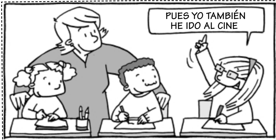
Decir lo que pienso.