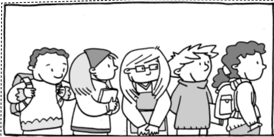
Colocarme bien en la fila.